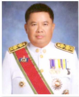
นายสฤทธ์ วิฑูรย์

ผู้ว่าราชการจังหวัดอุบลราชธานี หัวหน้ากลุ่มจังหวัดภาคตะวันออกเฉียงเหนือตอนล่าง 2